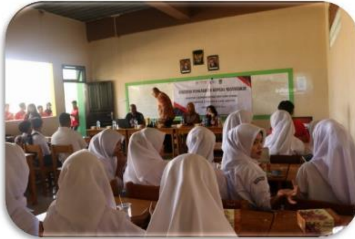
Gambar 1. Peserta Kegiatan Seminar