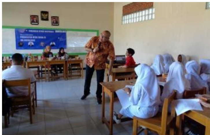
Gambar 2. Peserta Kegiatan Seminar