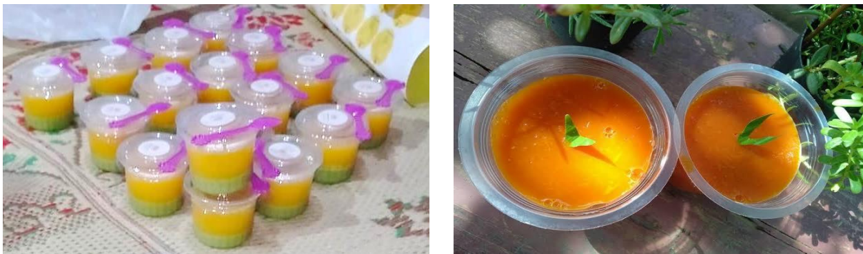
Gambar 3. Hasil Produk Olahan Puding Sayur

Kegiatan Pengabdian masyarakat ini telah terlaksana mulai dari tahap perencanaan, pelaksanaan dan evaluasi dengan lancar. Tahap Perencanaan dalam pengabdian masyarakat ini yaitu mendapatkan izin dari berbagai pihak terkait, tersusunnya materi yang digunakan, pembuatan pudding sayur serta melakukan diskusi dengan bidan desa dan kader posyandu terkait pelaksanaan kegiatan pengabdian masyarakat ini. Tahap Pelaksanaan meliputi pelaksanaan pre test kemudian pemberian edukasi, demonstrasi serta dilanjutkan diskusi kelompok kecil dan acara kuis yang terakhir adalah pelaksanaan post test, dalam tahap ini peserta yang mengikuti sebanyak 17 orang yang meliputi ibu-ibu PKK dan Perangkat Desa. Tahap evaluasi, mengevaluasi dari edukasi yang diberikan dengan pelaksanaan post test. Adapun hasil produk pudding sayur dapat dilihat pada Gambar 3 .