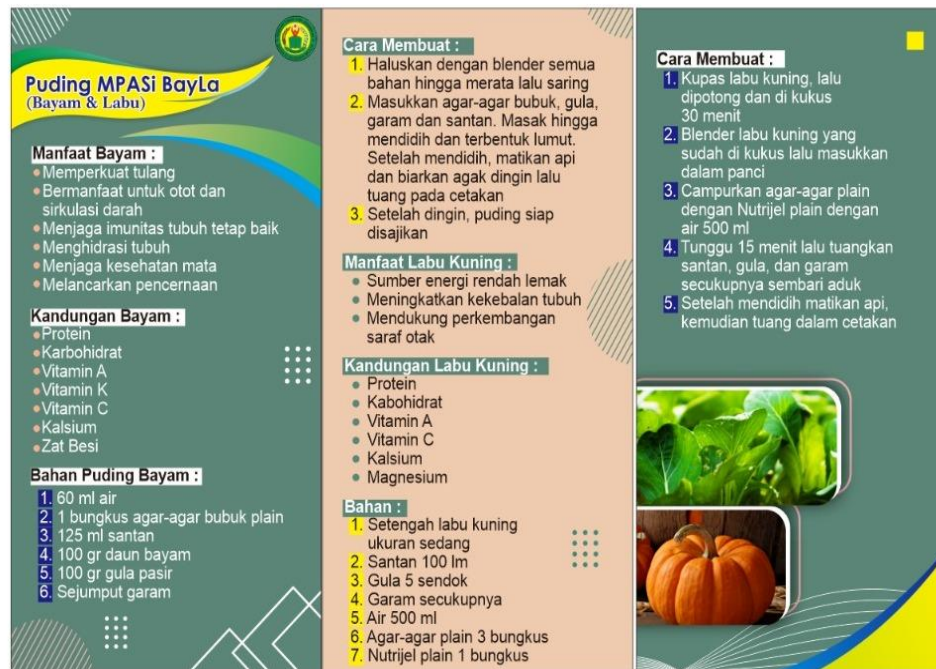
Gambar 4. Brosur Puding Sayur