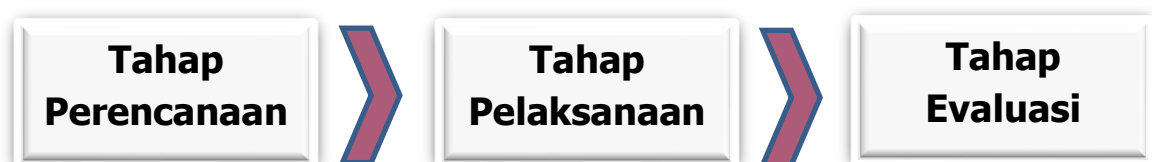
Gambar 1. Tahap Kegiatan Pengabdian Kepada Masyarakat

Adapun tahapan dalam melaksanakan pengabdian kepada masyarakat bertujuan untuk memberikan pemahaman kepada masyarakat mengenai pencegahan stunting dari produk olahan puding sayur serta pembagian tablet tambah darah terdiri dari beberapa tahapan seperti pada Gambar 1 .