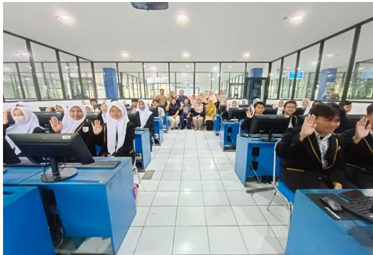
Gambar 2. Pelatihan Bersama Kepala Sekolah SMK Triguna 1956

acara PKM. Kegiatan ini bertujuan untuk meningkatnya kompetensi para siswa dalam menggunakan excel khususnya dalam hal mengembangkan sebuah aplikasi akuntansi ataupun aplikasi keuangan lainnya akan sangat melatih logika berpikir serta tingkat efisiensi dan efektifitas dalam bekerja nantinya. Adapun dokumentasi kegiatan tersebut dapat dilihat pada Gambar 2.