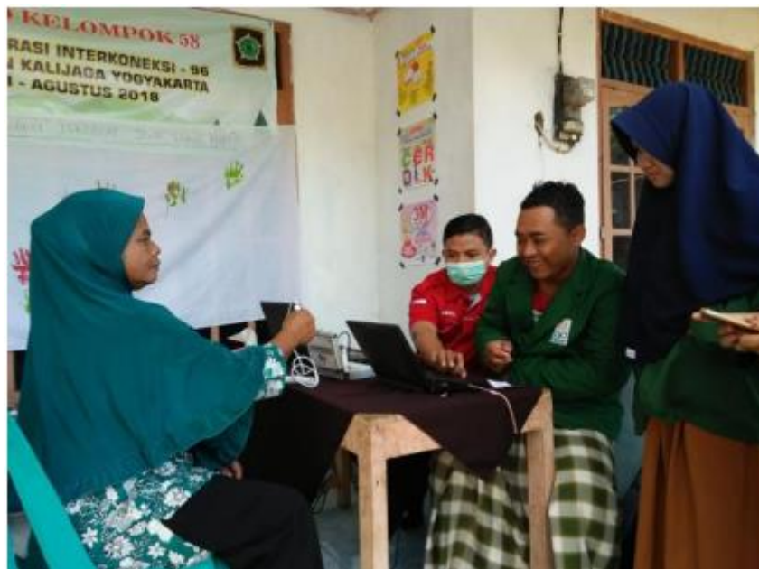
Gambar 1. Pengecekan Kesehatan Gratis

Mayoritas warga Pedukuhan Sarigono adalah pekerja ladang dan dapat dikatakan pekerja fisik yang berat sehingga tak jarang ditemukan beberapa warga yang mengeluhkan akan nyeri di badan, selain itu awamnya pengetahuan masyarakat akan informasi kesehatan membuat warga Sarigono mengabaikan beberapa hal yang dapat menyebabkan penyakit. Selain itu, Sarigono merupakan Pedukuhan yang terletak dataran tinggi dan termasuk padukuhan yang jauh dari pusat kota seperti kantor desa, pasar, termasuk jarak ke puskesmas yang jarak tempuhnya 2 KM. Tujuan dari kegiatan pemanfaatan posyandi lansia melalui bentuk pengecekan kesehatan adalah agar warga Pedukuhan Sarigono mengetahui kondisi kesehatan mereka sehingga jika terdeteksi penyakit warga dapat menangani atau mengobatinya lebih dini. Adapun dokumentasi dari kegiatan tersebut dapat dilihat pada Gambar 1 .